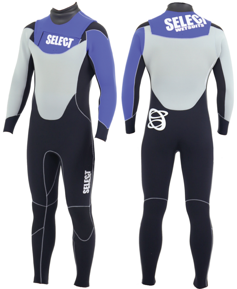
SBLFL43 SLANT BALLOON FULLSUITS 4/3 ¥81,000

ネオプレンの伸び率は最高で450%程度でした。 RFXの伸び率は約700%あるので、弾力性があり、着脱時のストレスを感じさせません。 また従来のものに比べ伸縮に余力があるため組織破壊が進みづらいというメリットがあります。