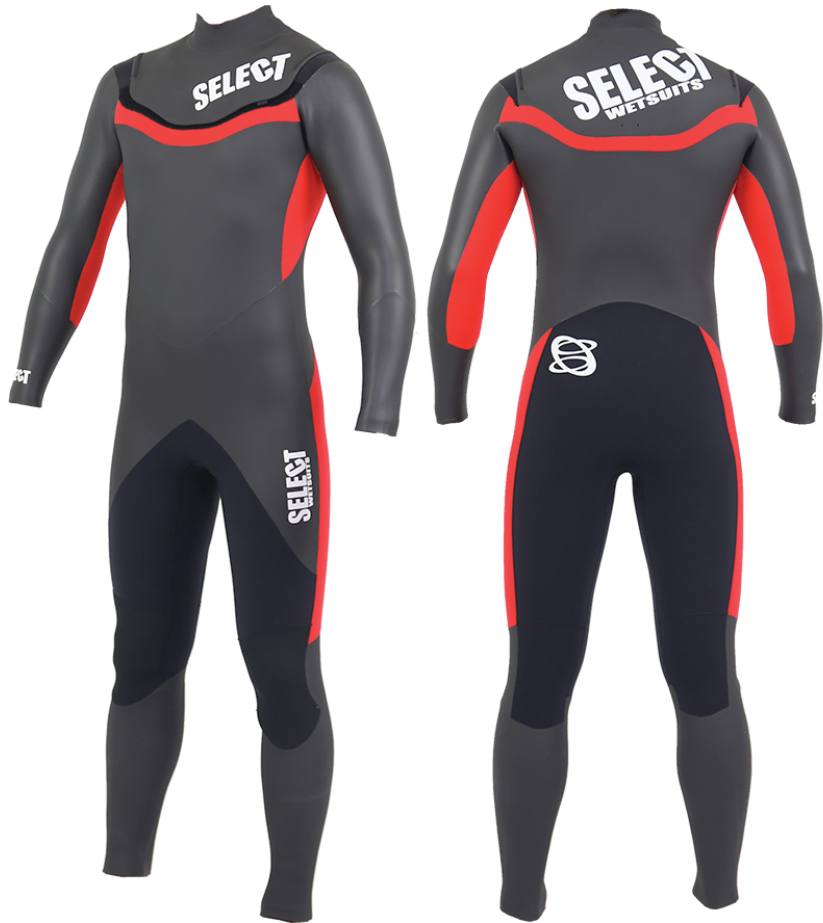
SWFL53 SCREW FW FULLSUITS 5/3 ¥75,000