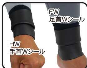
HW 手首Wシール FW 足首Wシール