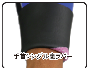
手首シングル裏ラバー