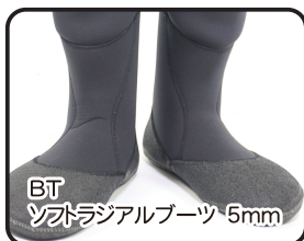
BT ソフトラジアルブーツ 5mm ソフトラジアルブーツは4mmベースのみ装着可能。 Size: 22~29 cm (1cm刻み)