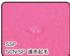
SSP SCN-SP 遠赤起毛

遠赤外線効果のSコロナを更に品質向上したストレッチ加工起毛素材。伸縮性・保温性・速乾性UP。