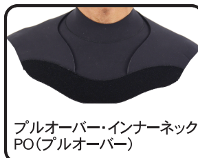
プルオーバー・インナーネック PO(プルオーバー)

スタンダードスキン:裏面に遠赤外線放射ジャージSCNを使用した保温性が高いスタンダードタイプ