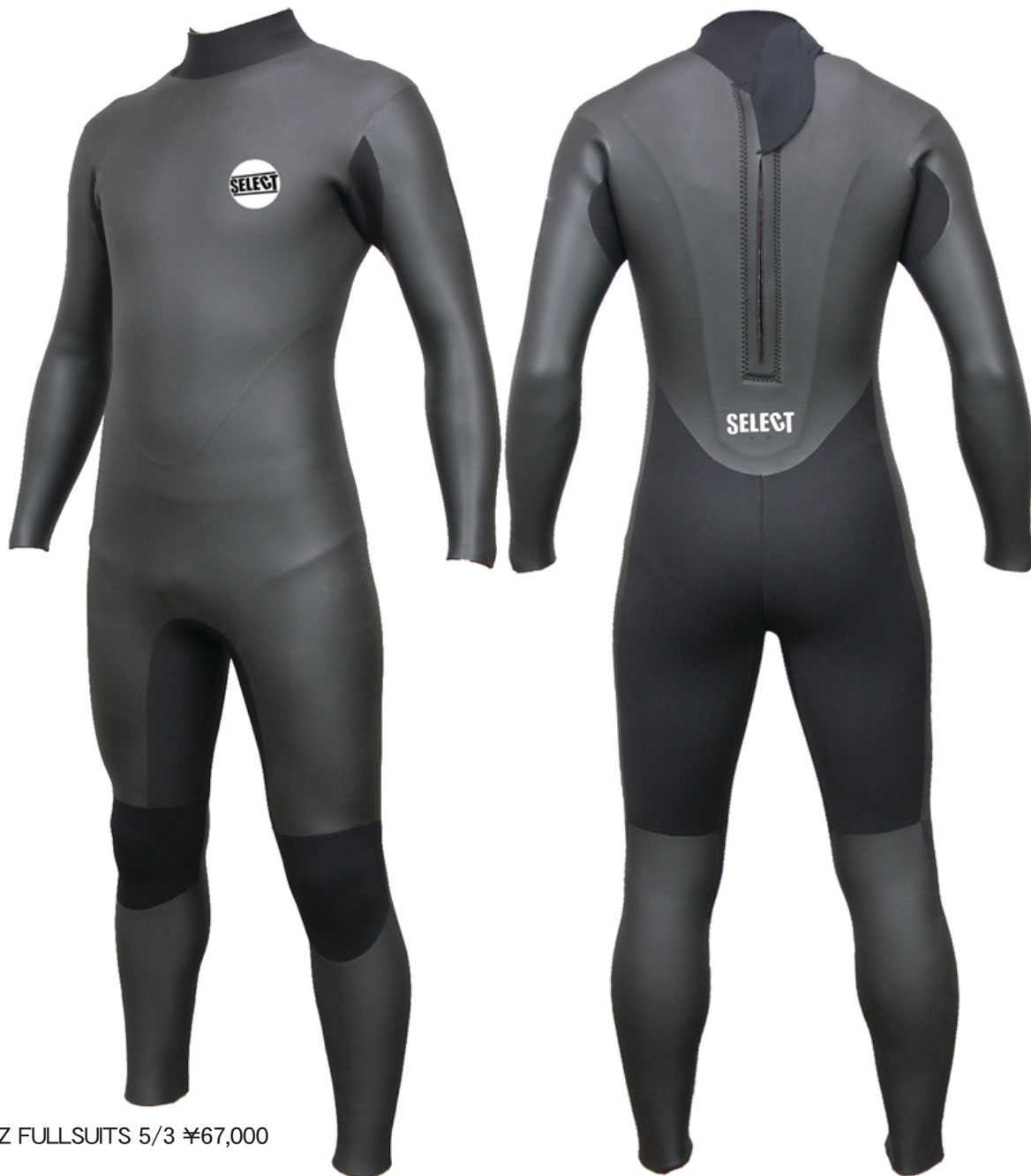
FW-R-15BZ FULLSUITS 5/3 ¥67,000

5/3mmのラバー全身SCN仕様。バックジップタイプのバリアネック付き。カラーブラックのみ