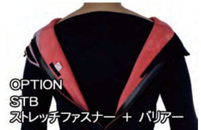
OPTION STB ストレッチファスナー + バリア