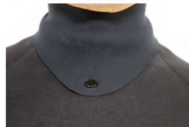
BLFL3 BALLOON FULLSUITS 3/3 ¥100,000 (税込¥110,000)

伸び率約700%のストレッチ素材 組織破壊が進みづらい(RFX700)で ストレスの無い着脱が可能