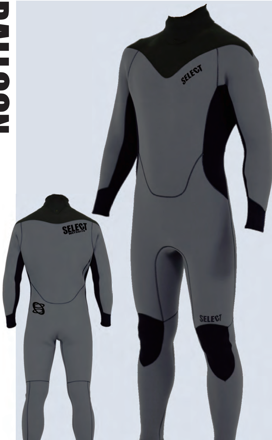
グレー / グレー