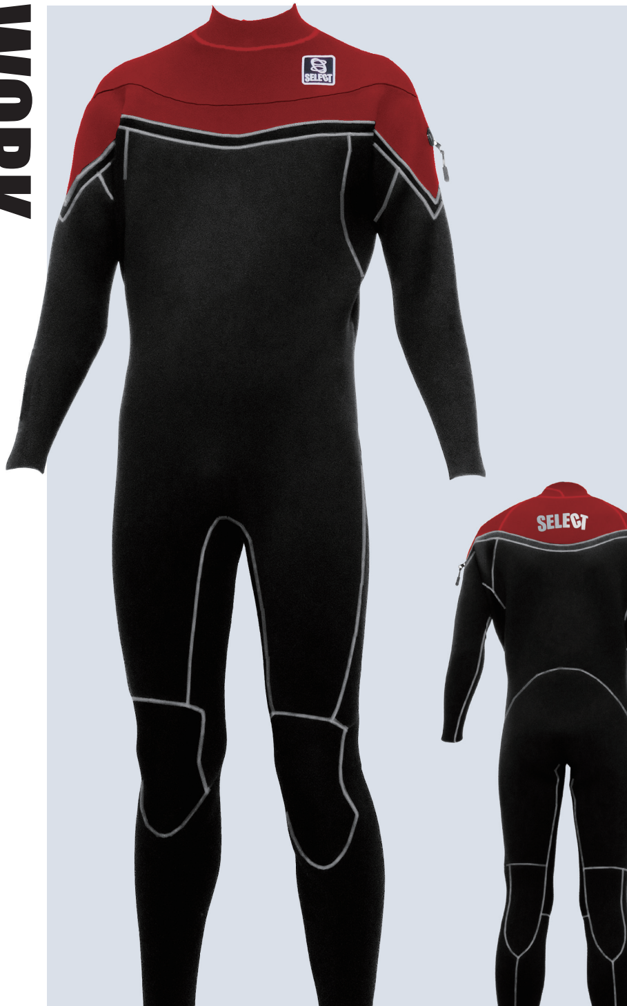
ブラック / レッド

WKLF3 WORK FULLSUITS 3/3 ¥87,000 (税込¥95,700)