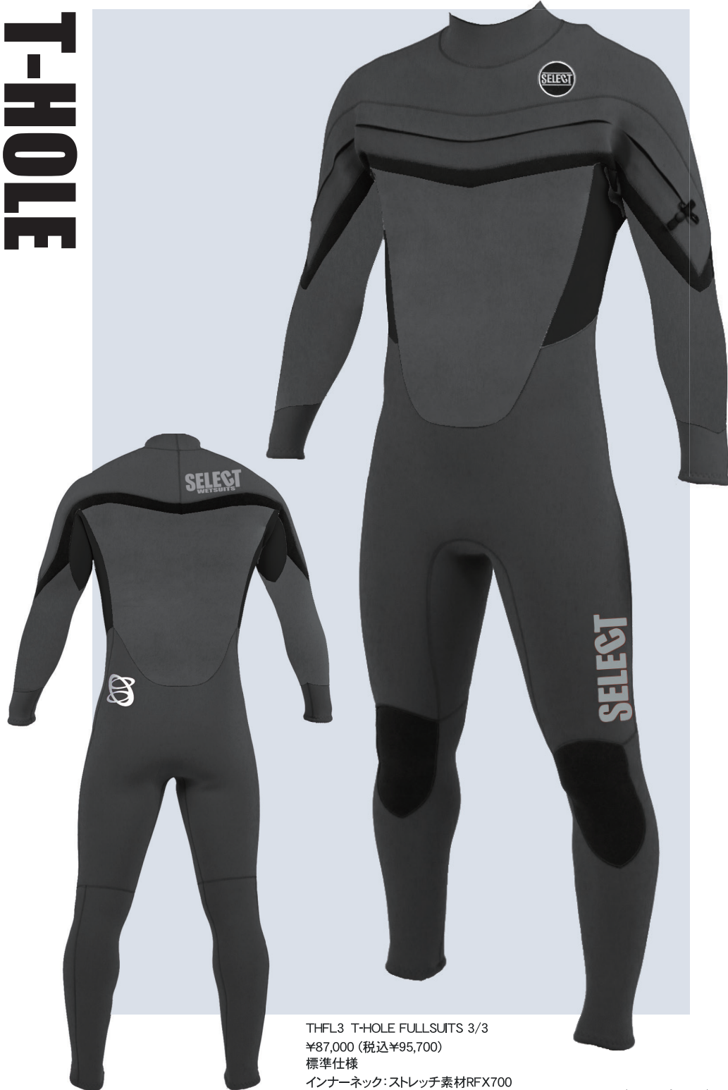
チャコールグレー / ブラック

THFL3 T-HOLE FULLSUITS 3/3 ¥87,000 (税込¥95,700) 標準仕様 インナーネック: ストレッチ素材RFX700 ひざパット5mmタフジャージ 手首・足首折り返し全ホリ 胸ワッペン: (1・2・3・4) 選択可能