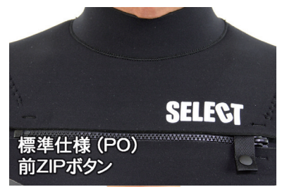
標準仕様 (PO) 前ZIPボタン