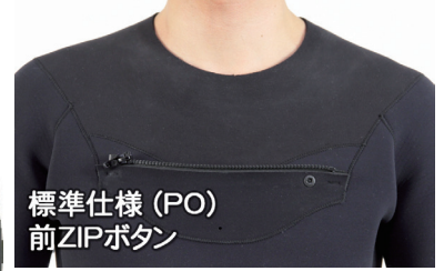
標準仕様 (PO) 前ZIPボタン

伸び率約700%のストレッチ素材 組織破壊が進みづらい(RFX700)で ストレスの無い着脱が可能