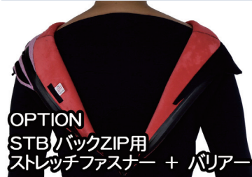
OPTION STB)バックZIP用 ストレッチファスナー + バリアー