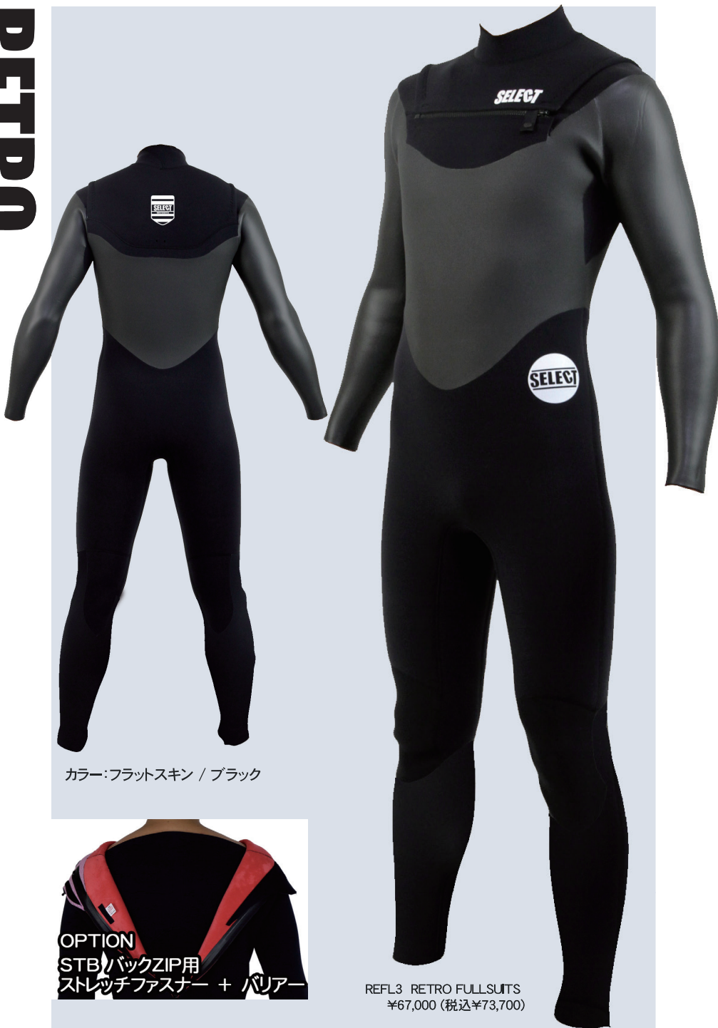
カラー:フラットスキン / ブラック