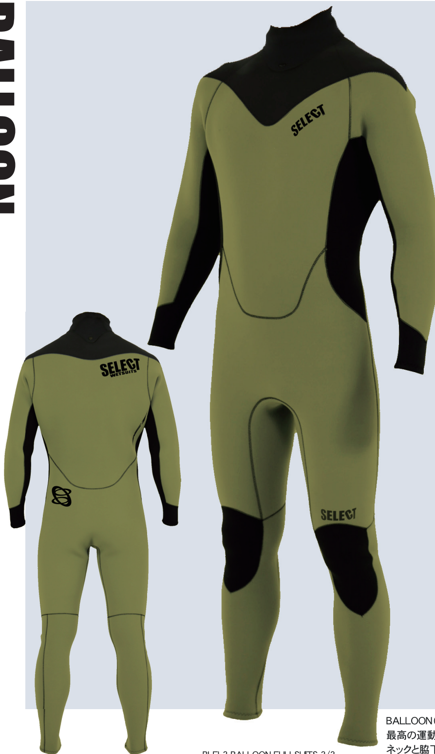
オリーブ / オリーブ