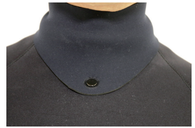
BLFL3 BALLOON FULLSUITS 3/3 ¥83,000 (税込¥91,300)

伸び率約700%のストレッチ素材 組織破壊が進みづらい(RFX700)で ストレスの無い着脱が可能