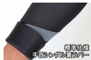
標準仕様 手首シングル裏ラバー