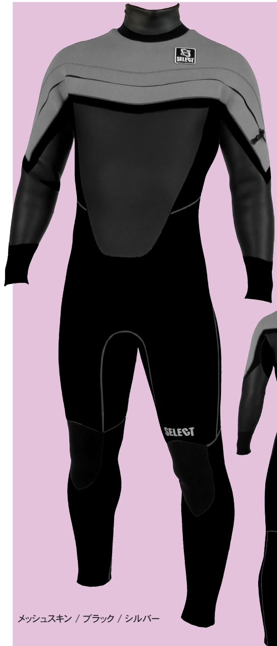
THFL53 T-HOLE FULLSUITS 5/3 ¥97,000 (税込 ¥106,700)