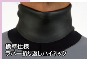
標準仕様 ラバー折り返しハイネック