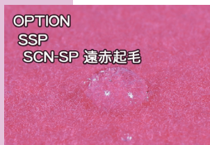
OPTION SSP SCN-SP 遠赤起毛