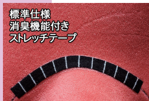
標準仕様 消臭機能付き ストレッチテープ