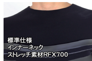
標準仕様 インナーネック ストレッチ素材RFX700