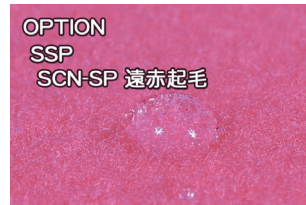
OPTION SSP SCN-SP 遠赤起毛