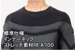
標準仕様 インナーネック ストレッチ素材RFX700