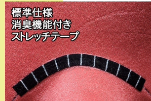
標準仕様 消臭機能付き ストレッチテープ