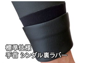
標準仕様 手首 シングル裏ラバー