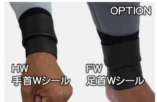
OPTION HW 手首Wシール FW 足首Wシール