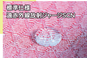
標準仕様 遠赤外線放射ジャージSCN