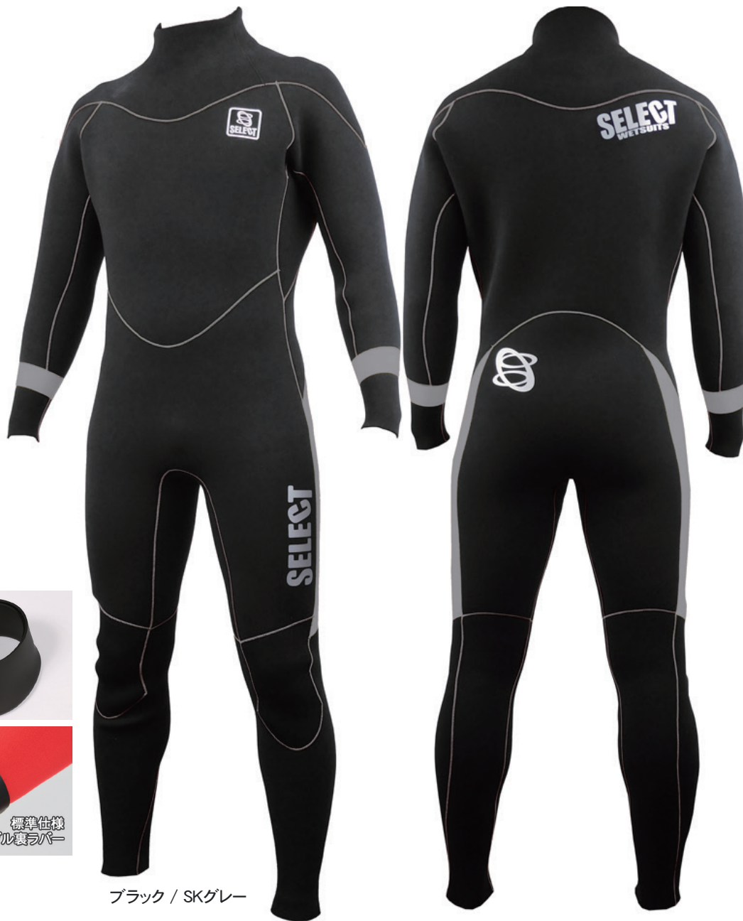
ブラック / SKグレー