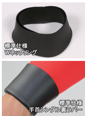
標準仕様 Wネックリング