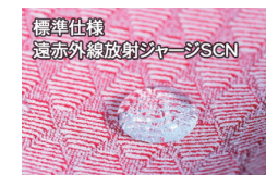
標準仕様 遠赤外線放射ジャージSCN