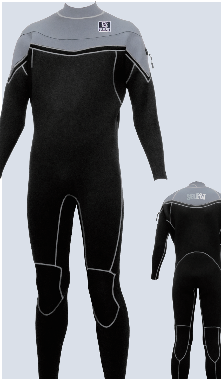
WKLF3 WORK FULLSUITS 3/3 ¥86,000 (税込¥94,600)