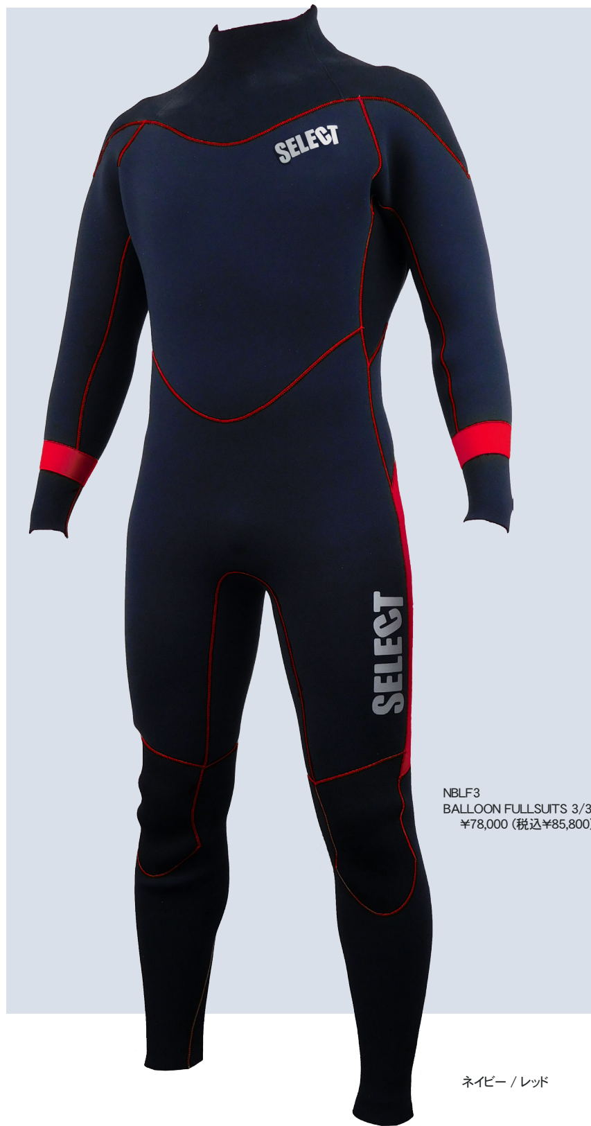
NBLF3 BALLOON FULLSUITS 3/3 ¥78,000 (税込¥85,800)