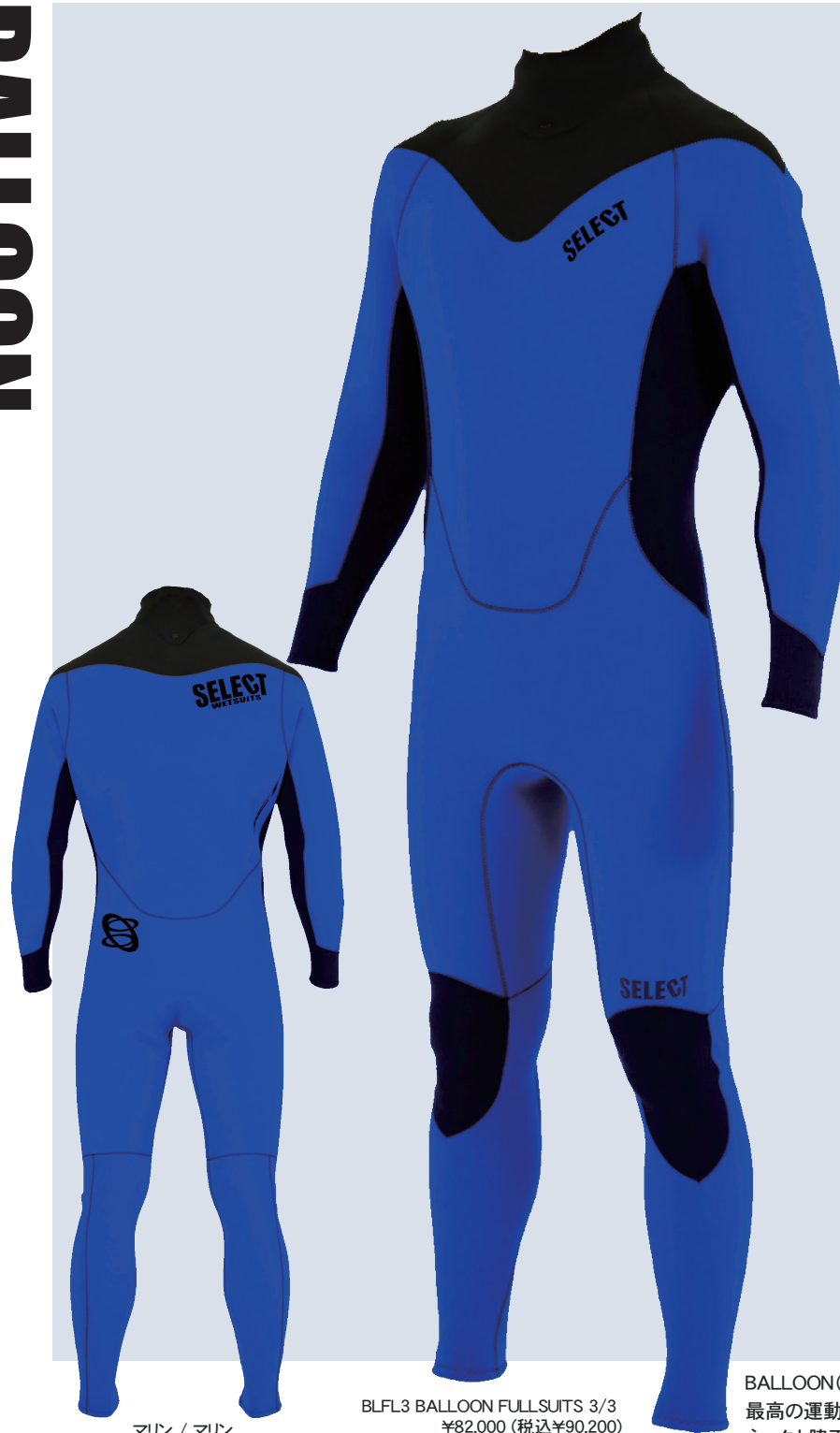
マリン / マリン