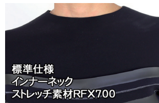
標準仕様 インナーネック ストレッチ素材RFX700