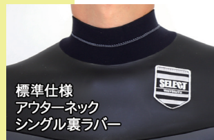
標準仕様 アウターネック シングル裏ラバー