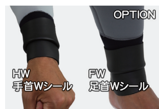
HW 手首Wシール FW 足首Wシール