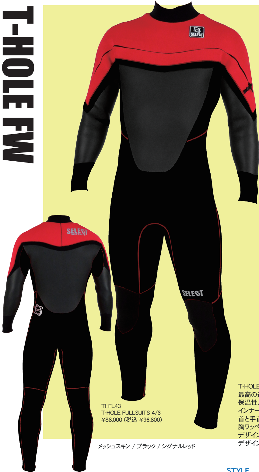
THFL43 T-HOLE FULLSUITS 4/3 ¥88,000 (税込 ¥96,800)