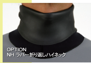
OPTION NH ラバー折り返しハイネック