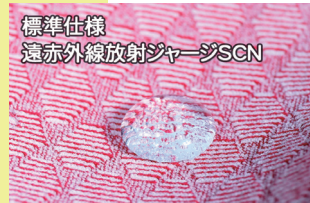
標準仕様 遠赤外線放射ジヤージSCN