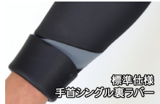
標準仕様 手首シングル裏ラバー