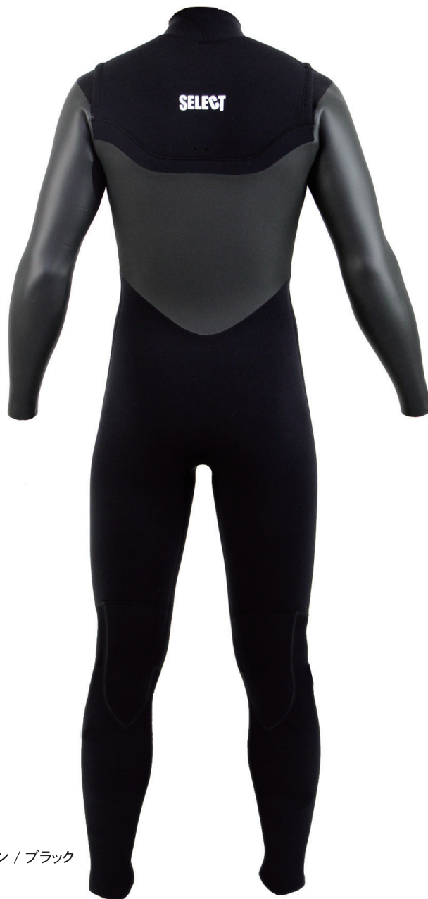
メッシュスキン / ブラック