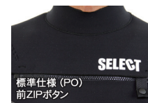
標準仕様 (PO) 前ZIPボタン