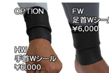
OPTION HW 手首Wシール ¥6,000 FW 足首Wシール ¥6,000