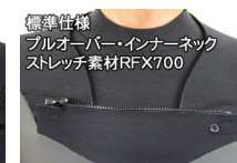
標準仕様 プルオーバー・インナーネック ストレッチ素材RFX700